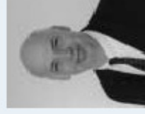
DI Rastimir Nemostichy Österreichische Energieagentur