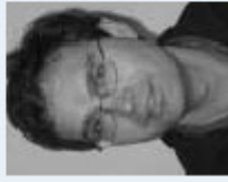
DI Johannes Ewchner 17-4 Organisations GmbH