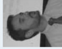
DI Eugen Nafitz Enertec Hafitz & Partner OEG