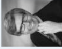
DI Walter Boitz Energie-Central GmbH