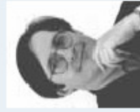
Mag. Johannes Mayer Energie Central GmbH