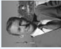
DI Jari Iljoi Grazer Energieagentur